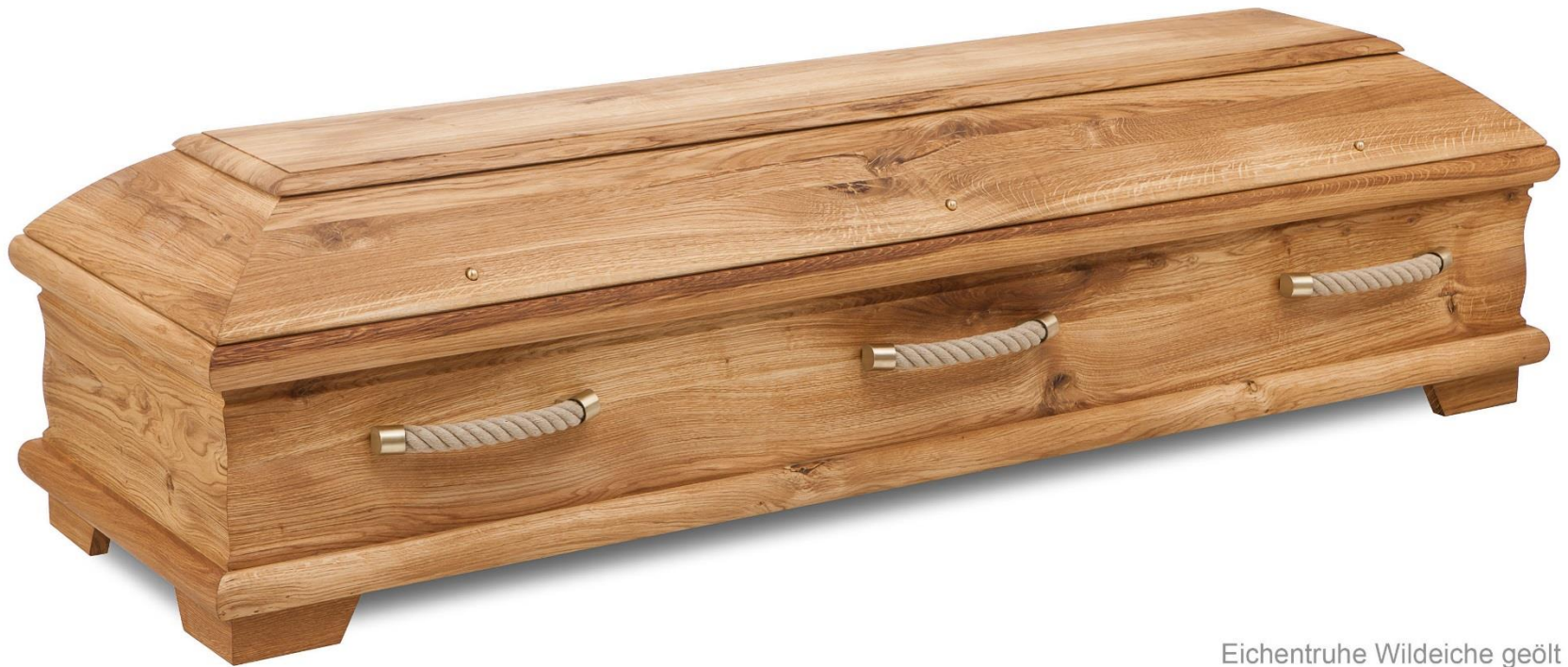
Eichentruhe Wildeiche geölt