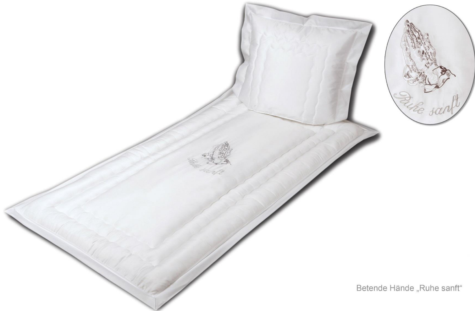
Betende Hände „Ruhe sanft“