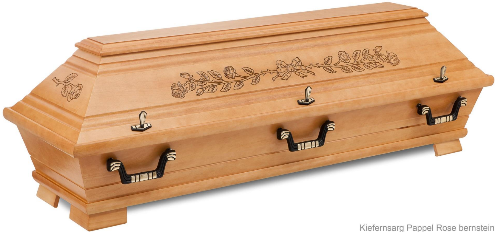
Kiefernarg Pappel Rose bernstein