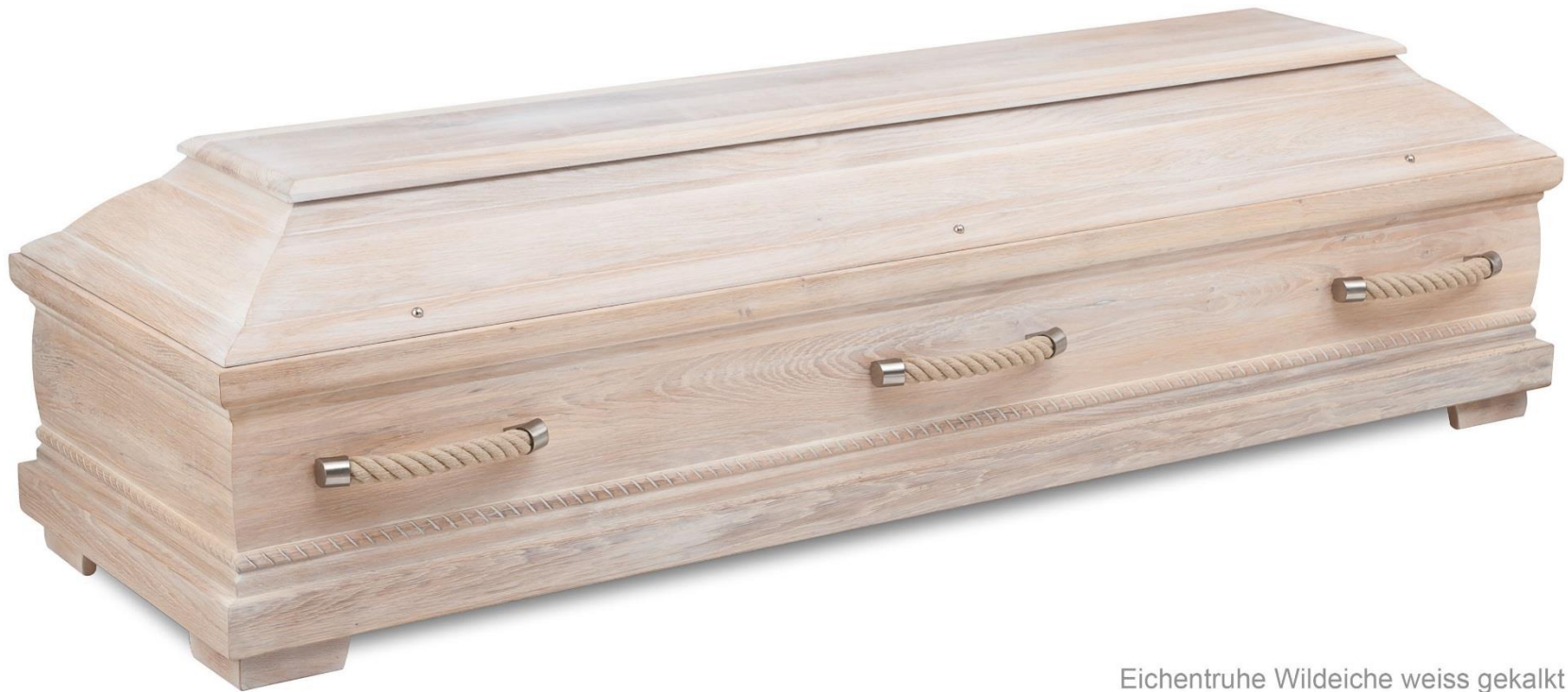
Eichentruhe Wildeiche weiss gekalkt