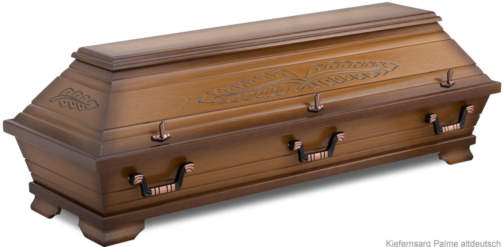
Kiefernarsarg Palme altdeutsch