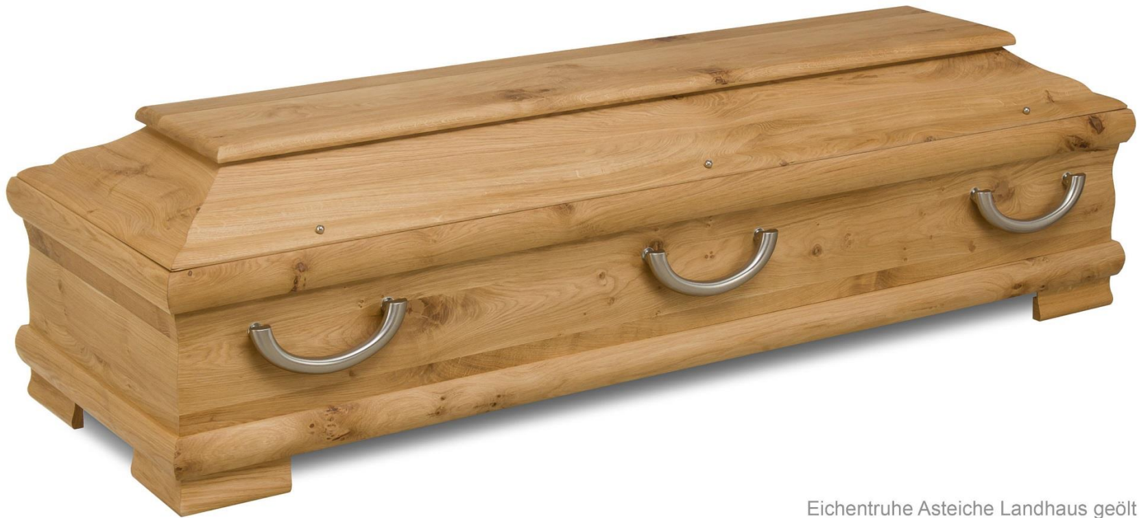
Eichentruhe Asteiche Landhaus geölt