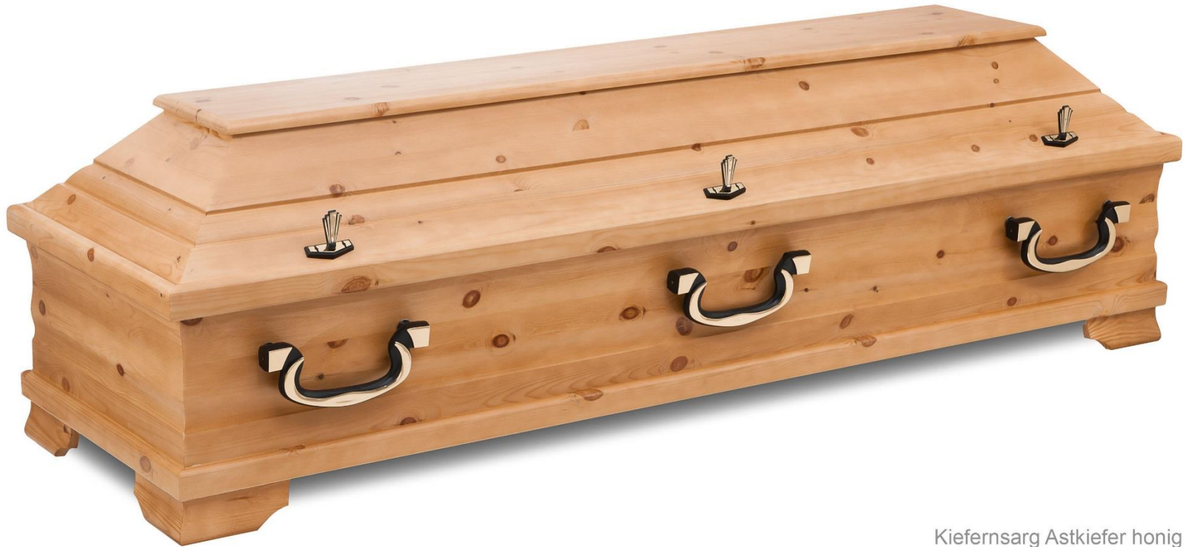
Kiefernarsarg Astkiefer honig